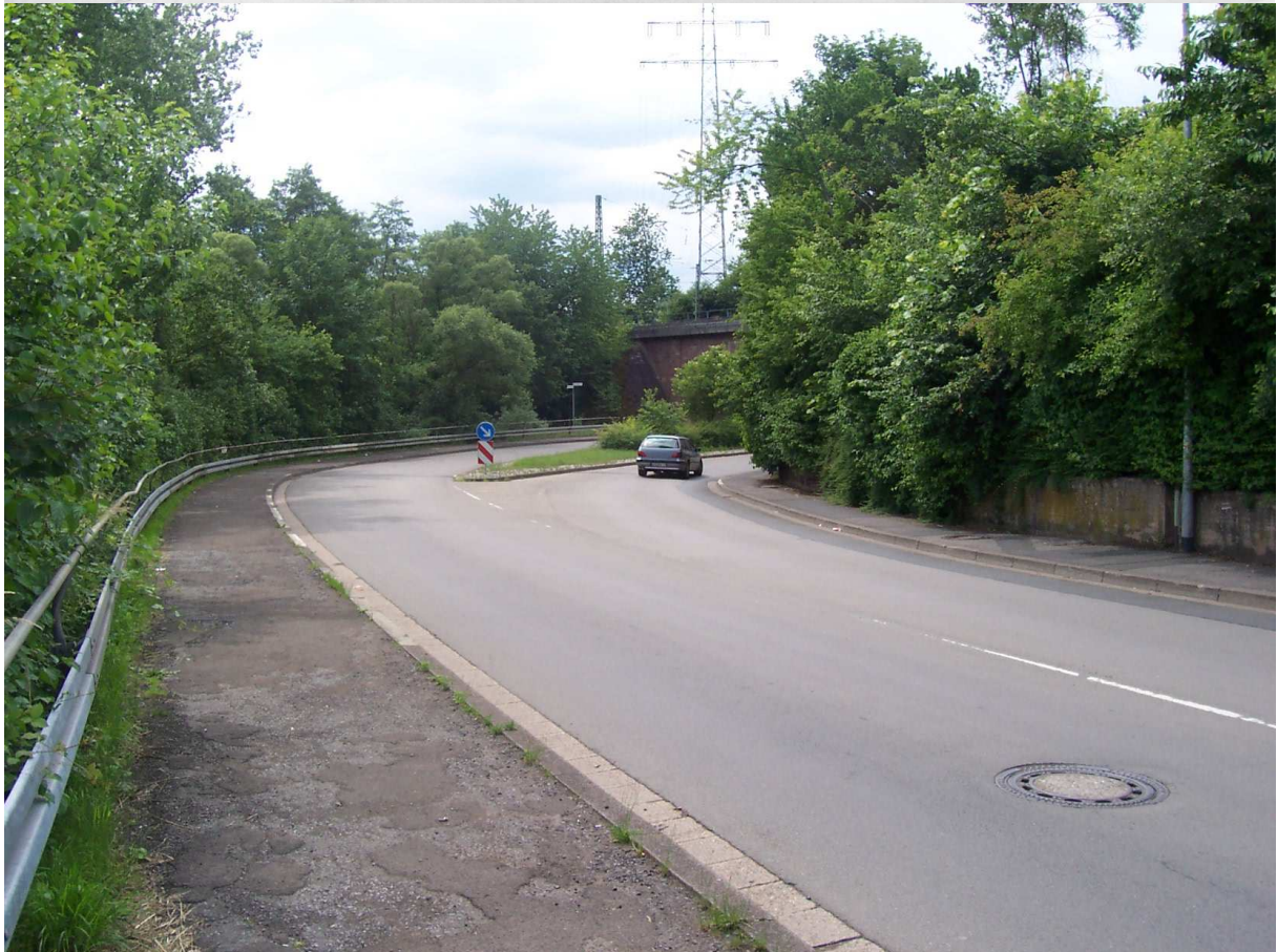
am Gaskessel, ausgangs der Bliesbrücke in Richtung Mommstraße und Bahnhof