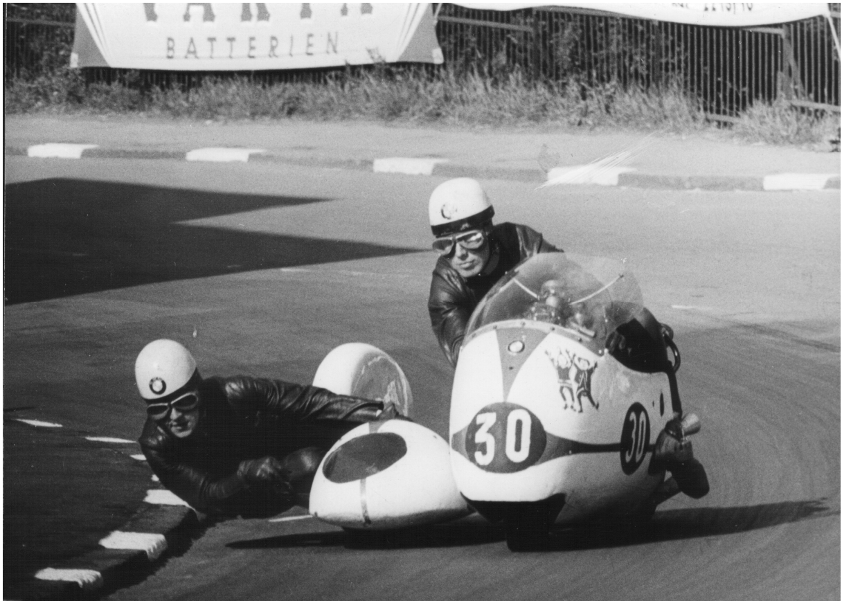
2.Kurve Tholeyer Berg