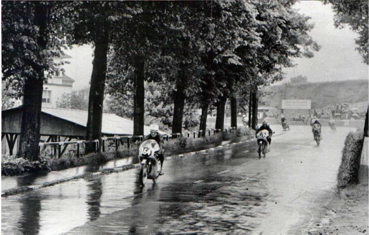
gleich geht es durch die obige Unterführung