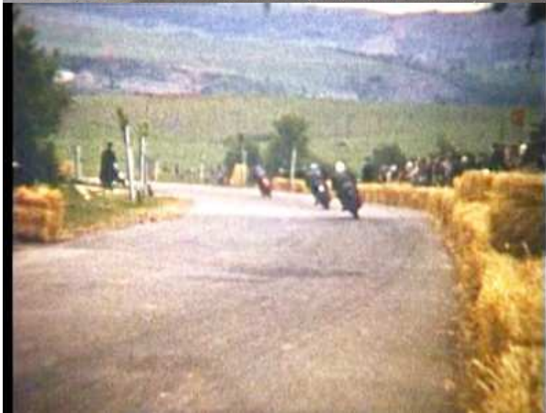
Hinab zu Start und Ziel