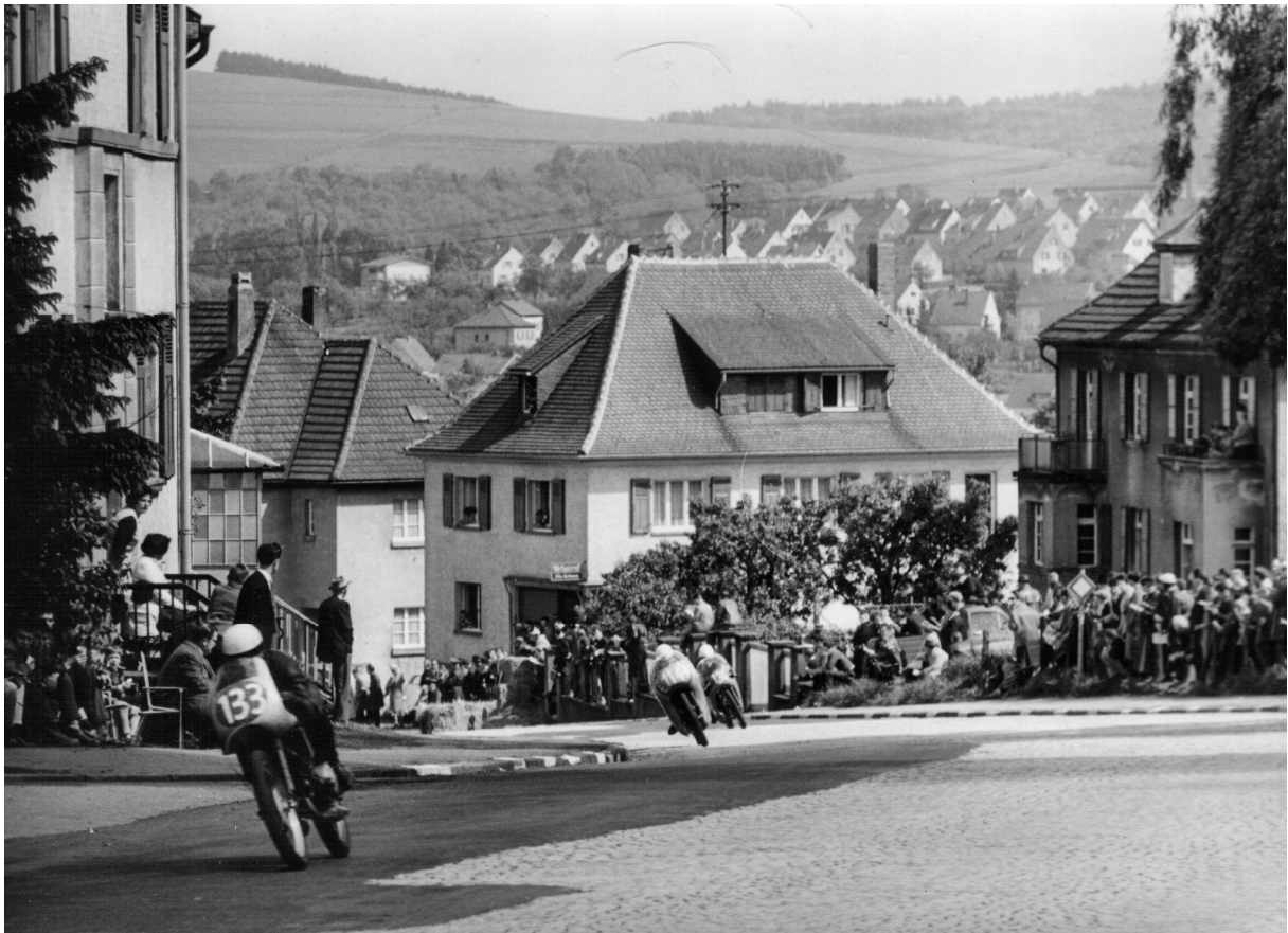
Hier stimmt der Standort fast genau