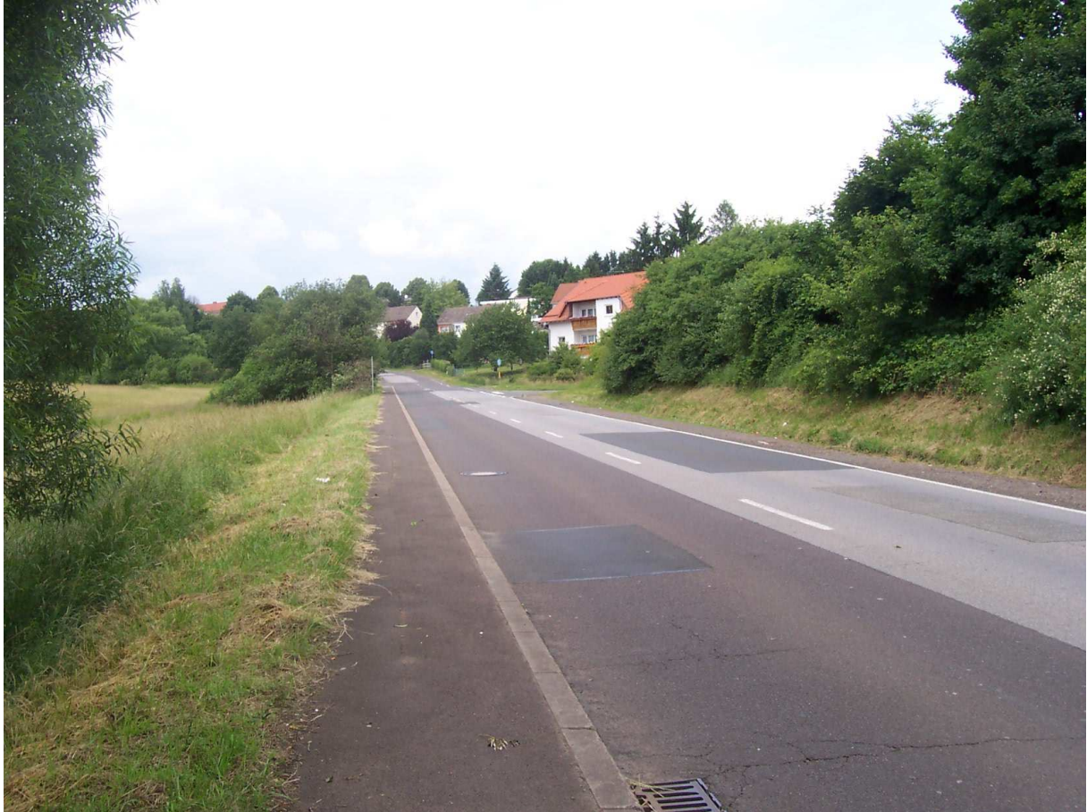
Hier war mal Start und Ziel