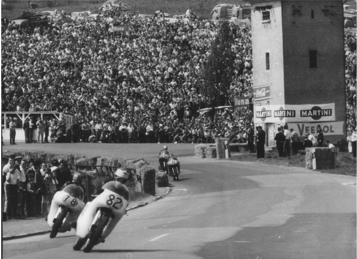
Früher führte die Strecke hinter dem Transformatorenturm herum