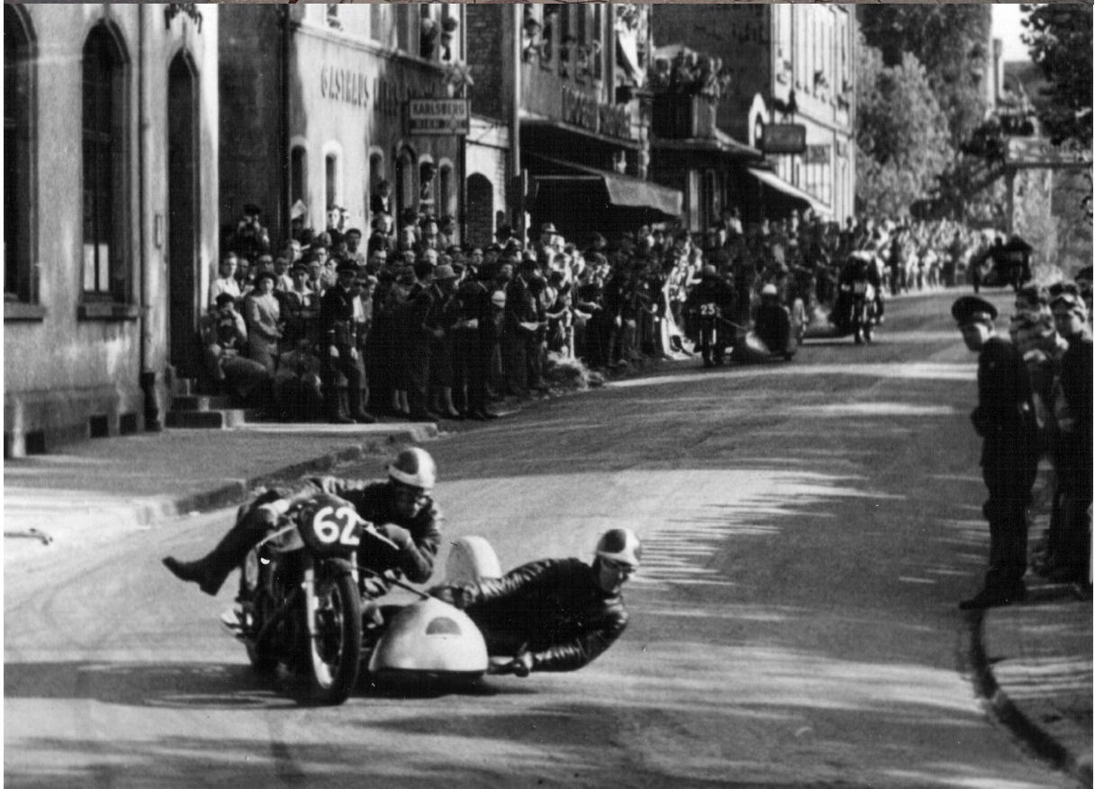
Hier steppte der Bär, Eingangs Eisenbahnunterführung Richtung Tholeyer Berg