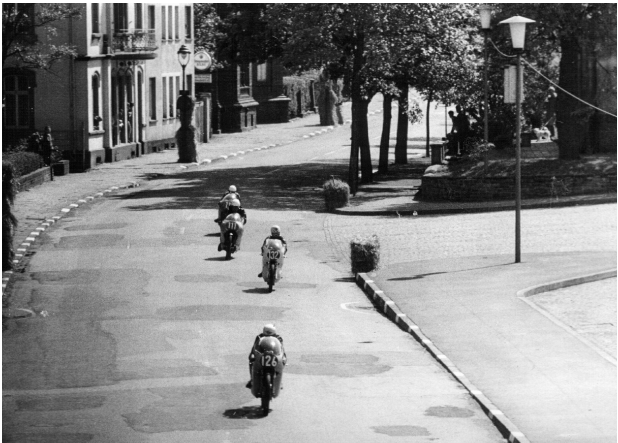
ziemlich genau hier ist heute ein Kreisverkehr